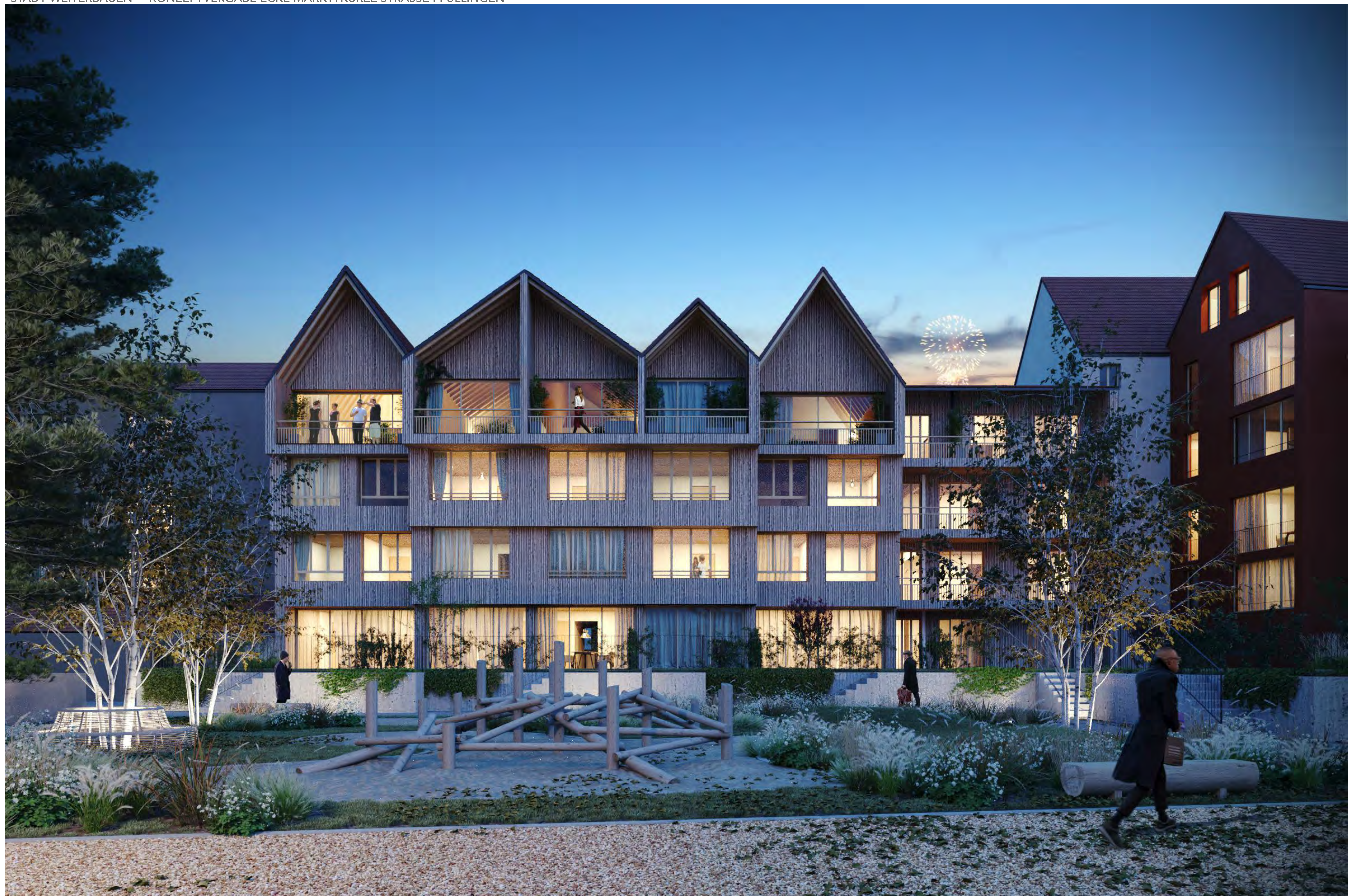
Ansicht West "Park" ein versteckter, ruhiger Grünraum kann zu einem Treffpunkt im Quartier werden