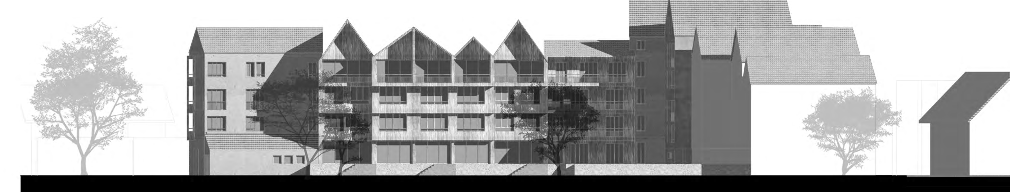
Ansicht West "Park" 1:200