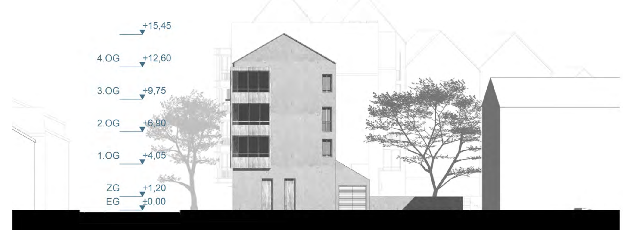
Ansicht Nord 1:200