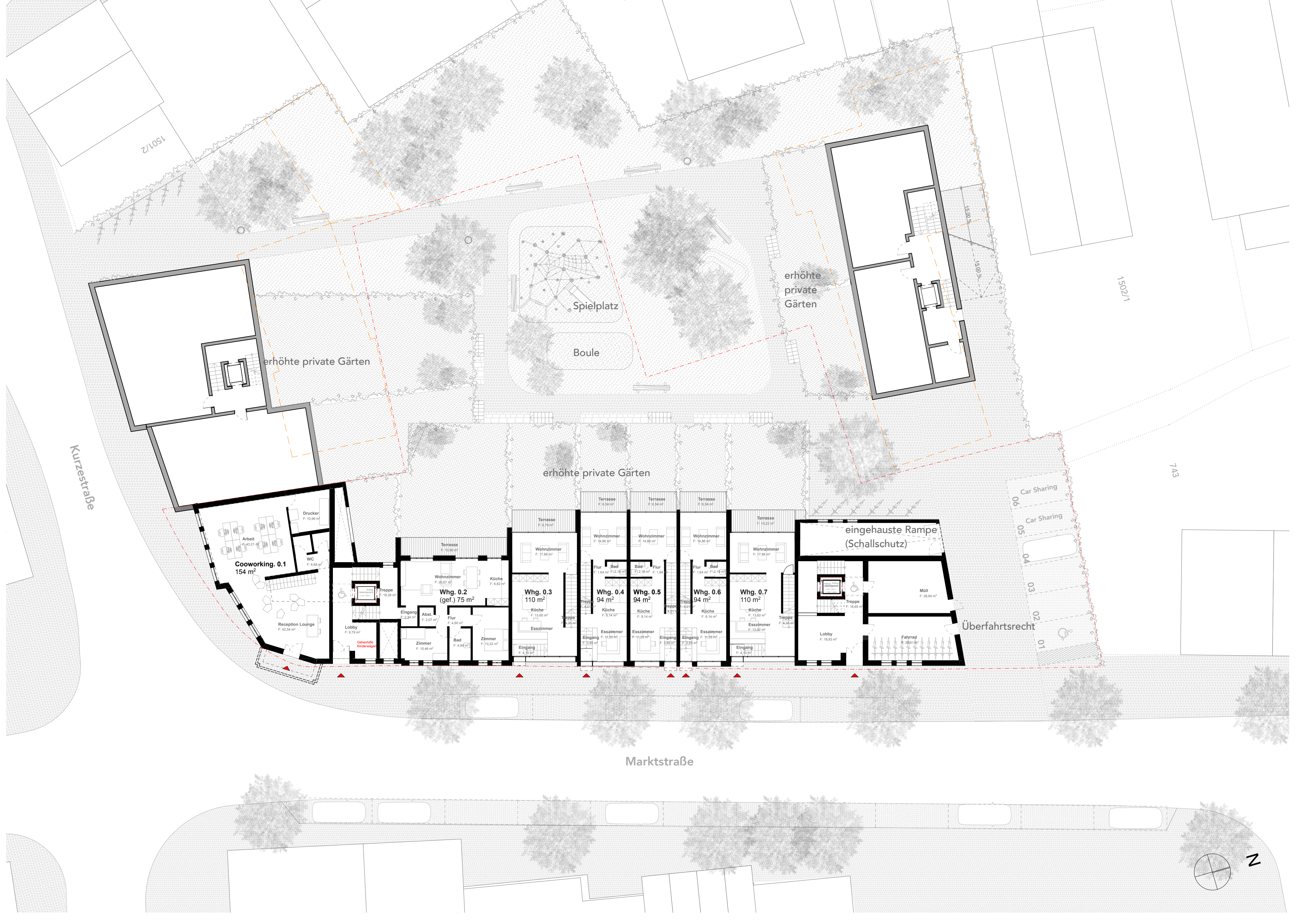
erhöhtes Erdgeschoß und Freiraumgestaltung 1:200 (mit Vorschlag für das gesamte Betrachtungsgebiet)